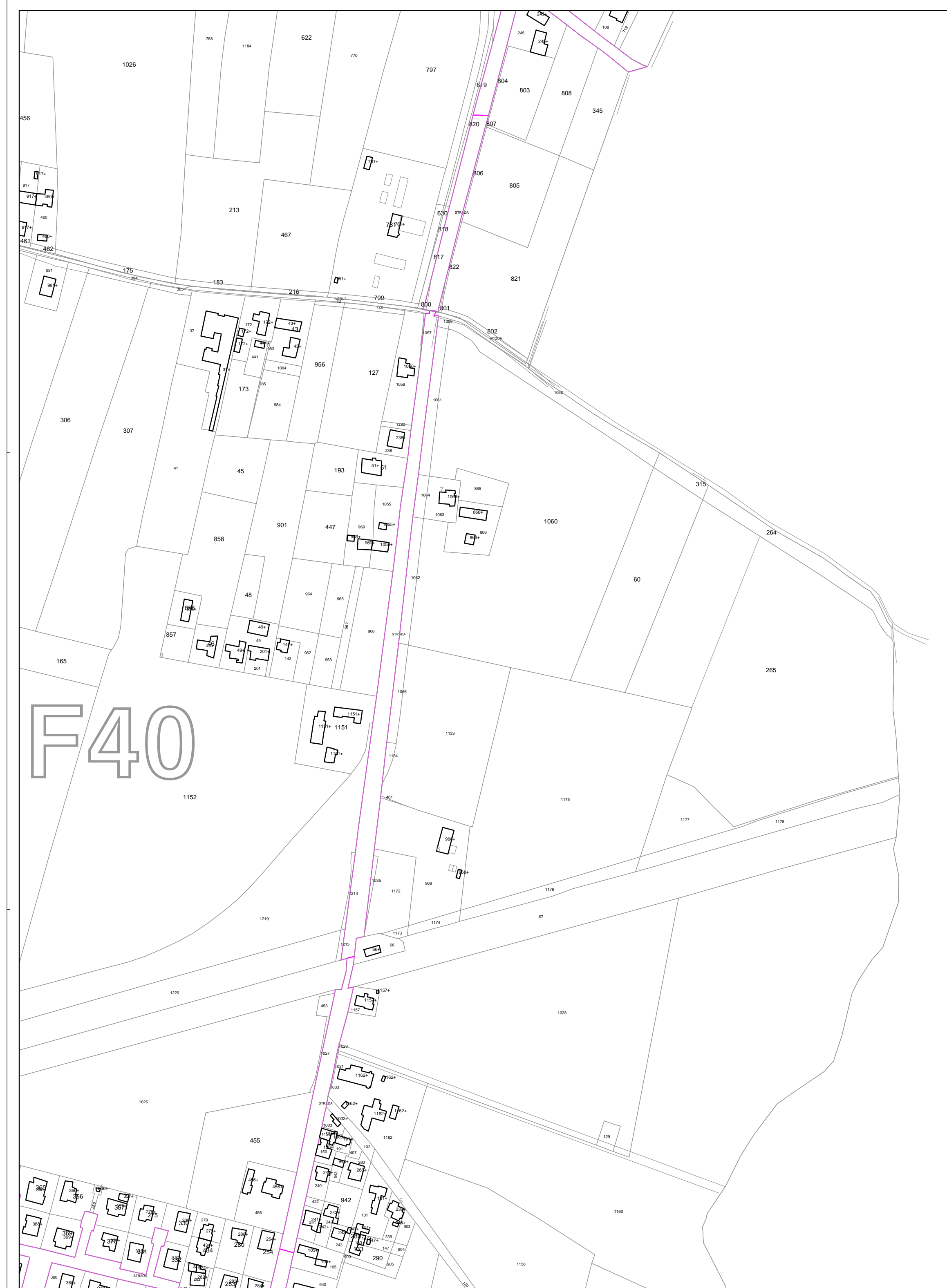
ESTRATTO CATASTALE scala 1:2000